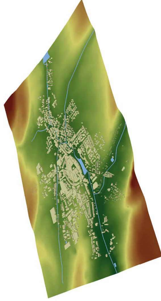
Mapa č. 30d: Digitální model území Poličky a okolí s vyznačením půdorysu města a uličních bloků, počátek 21. století