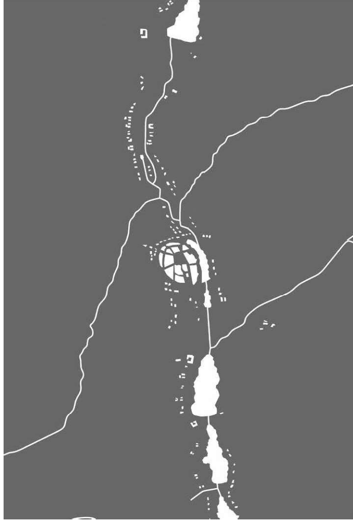
Mapa č. 30a: Negativní plán Poličky a okolí s vyznačením půdorysu města a uličních bloků, 1780–1783